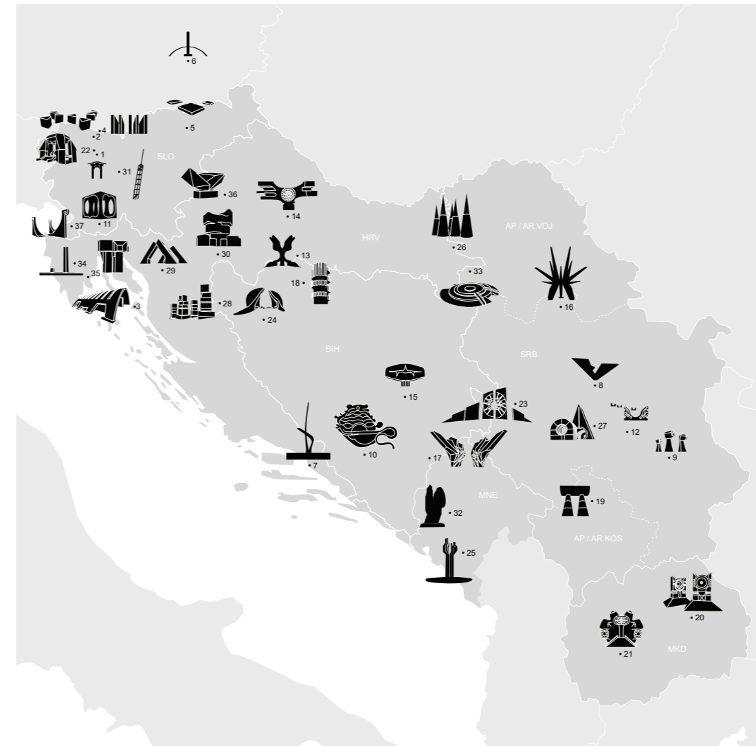
Opomba: Uporabljena so imena nekdanjih republik in avtonomnih pokrajin SFR Jugoslavije. Napomena: Korištena su imena nekadašnjih republika i autonomnih pokrajina SFR Jugoslavije. Note: The exhibition uses the names of the former republics and autonomous regions of SFR Yugoslavia.

Ljubljana, november / November 2019, julij / July 2021